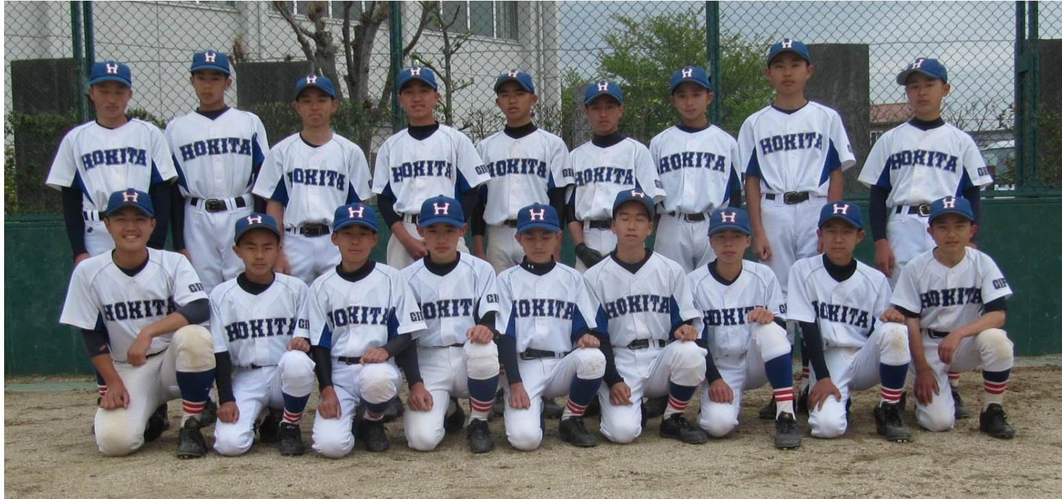
第2代表：穂積北中学